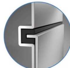
Sealed Lock-and-Key Design

Na zadní straně je k dispozici celá řada portů, mezi nimiž vyčnívá především rozhraní HDMI 2.0 , které zajistí snadné promítání 4K obsahu při vyšším jas a kontrastu oproti standardnímu rozlišení. Jas je klíčem k viditelnosti. I proto nabízí projektor BenQ LU9245 funkci dynamického tlumení jasu dle scény a optimalizuje světelný výkon a kontrast pro co nejlepší obraz.