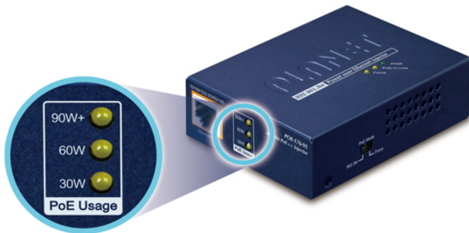
PoE Power Usage Display