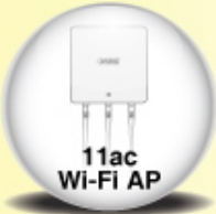
11ac Wi-Fi AP