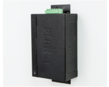
Side Wall Mounting (Space saving)